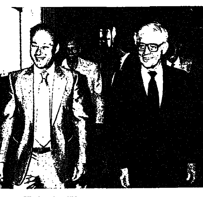
السيد اندرسون أثناء دخوله فندق الملك داود في القدس

قسي الشرق الاوسط قيا - ذكر موظفون في وزارة الخارجية النمساوية انها امس ان لبنان اثنى على سياسة التسا في الشرق الاوسط والجهود التي تبذلها من اجل احلال السلام في المنطقة . وقال السيد فؤاد بطرس وزير الخارجية اللبناني الذي يزور فينا حالياً ان السياسة الخارجية النمساوية التي تتبناها تساهم في تسهيل الامم المتحدة في تحقيق السلام في الشرق الاوسط . واضاف ان النمسا تسحق التقدير على اعترافها بحق الشعب الفلسطيني في تقرير مصيره ودولته واكد ان السلام في لبنان يتعلّق بايجاد حل للشكثة الفلسطينية . ومن المقرر ان يجتمع السيد بطرس اليوم مع رئيس النمسا .